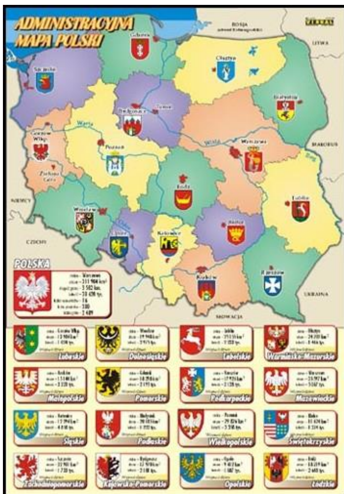
70cm x 100cm, Cena: £9.99